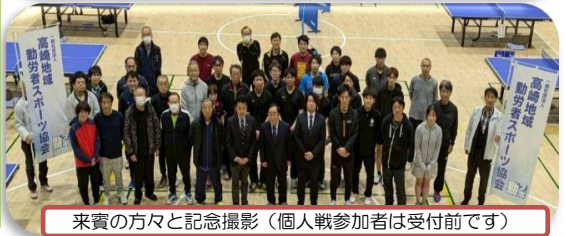
来賓の方々と記念撮影(個人戦参加者は受付前です)